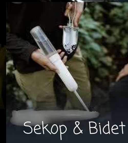
Sekop & Bidet