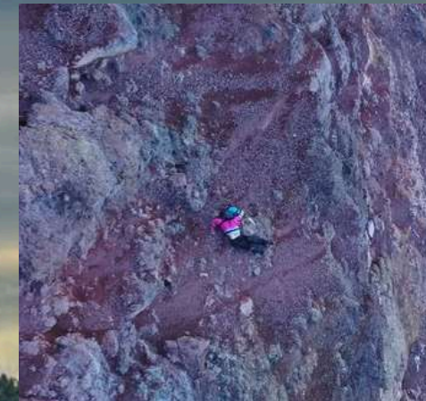
Terjatuh dari gunung